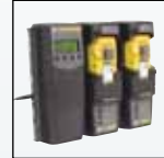
Compatibile con MicroDock II