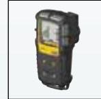
Guscio di protezione antiurto

Per un elenco completo degli accessori contattare BW Technologies by Honeywell.