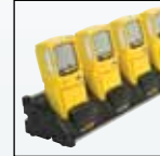
Caricabatteria da tavolo per multi-unità